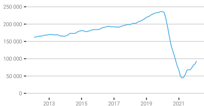
Fig. 1. Évolution de la fréquentation touristique