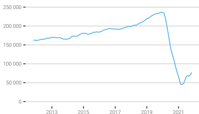
Fig. 1. Évolution de la fréquentation touristique