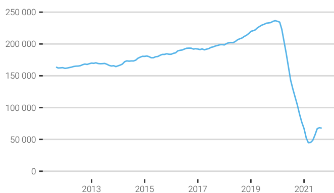
FIG. 1. Évolution de la fréquentation touristique