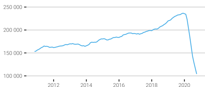
FIG. 1. Evolution de la fréquentation touristique