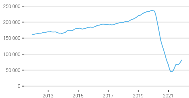
Fig. 1. Évolution de la fréquentation touristique