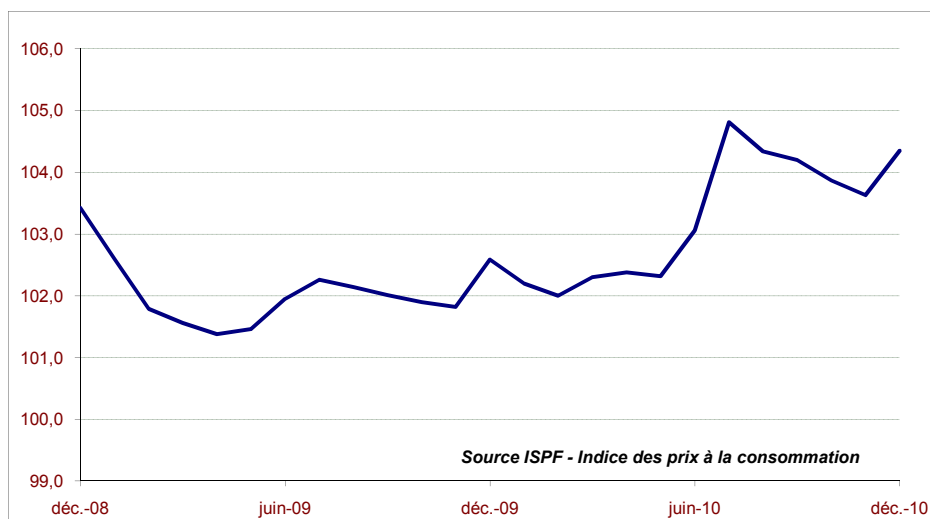
Evolution de l'indice des prix à la consommation au cours des 24 derniers mois - Base 100 Décembre 2007 -

N° 439 Décembre 2010 Dépôt légal : Janvier 2011