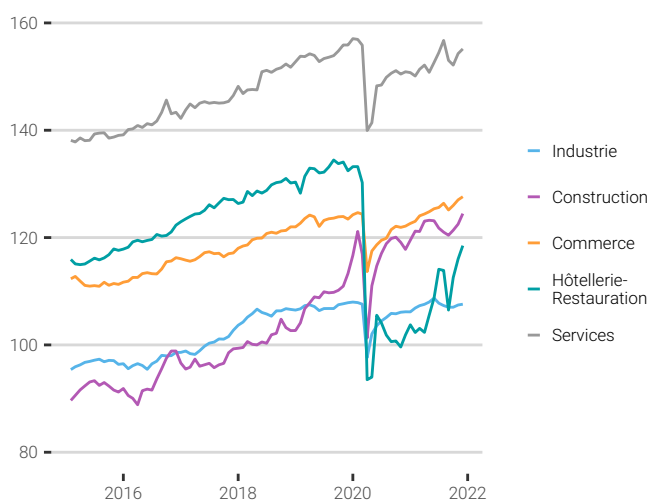
Fig. 2. Évolution des indices par secteur d'activités

Source : CPS - ISPF, données corrigées des variations saisonnières (CVS) Indice 100 en janvier 2000