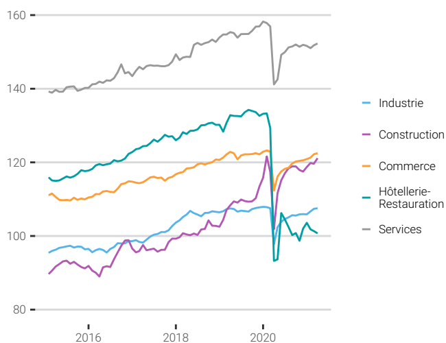
Fig. 2. Evolution des indices par secteur d'activités